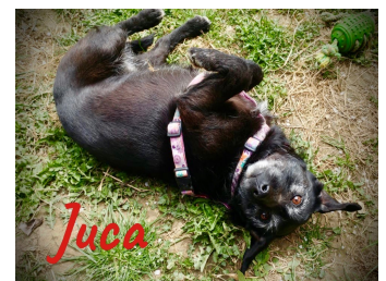
Juca rollt sich so gerne im Gras