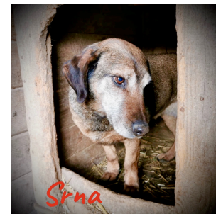
Srna im Lager mit dem Einzigen was sie hatte, eine kleine Hütte mit Stroh

bereits geimpft, gechippt und sterilisiert. Sie ist stubenrein und sehr, sehr artig. Schön wäre ein Platz als Zweithund oder bei Menschen die viel Zeit für sie haben. Auch über eine Patenschaft bis zur Vermittlung würden wir uns sehr freuen.