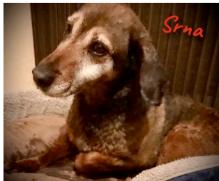
Srna, das erste Mal in einem weichen Körbchen, sie liebt es